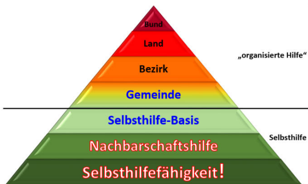
Abbildung 4:

Was uns oft erst im Katastrophenfall bewusst wird, sind die persönliche Rolle und die Vorsorgemaßnahmen jedes Einzelnen. Derzeit verlassen sich zu viele Menschen auf die organisierte Hilfe. Damit fehlt in vielen Bereichen eine ganz wesentliche Basis, um mit weitreichenden Infrastrukturausfällen umgehen zu können. Denn die Mitglieder der Einsatzorganisationen und deren Familien werden in einem solchen Katastrophenfall ebenfalls zu Betroffenen. Dadurch können sie anderen Menschen nur mehr eingeschränkt helfen.