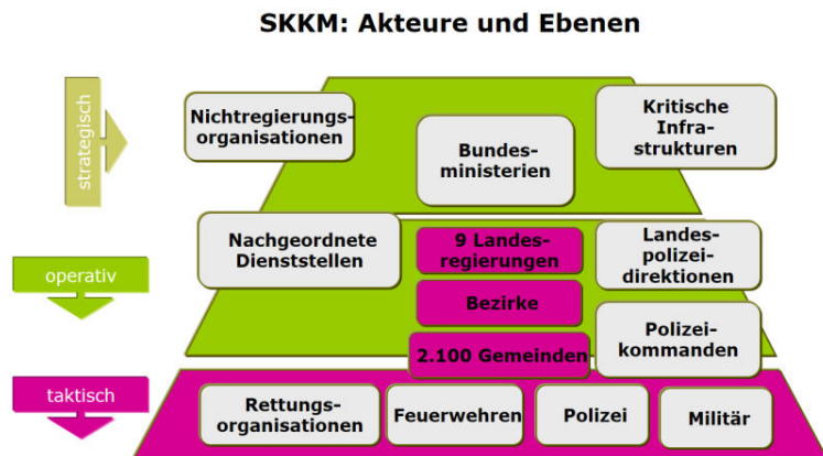
Abbildung 1:

Österreich verfügt über ein gut eingespieltes und erfolgreiches Staatliches Krisen- und Katastrophenmanagementsystem (SKKM). Die Katastrophenhilfe ist subsidiäre 6 organisiert. Das bedeutet, dass primär die Selbsthilfe in lokalen Strukturen („Bottom-up“ - engl. von unten nach oben) erfolgen muss.