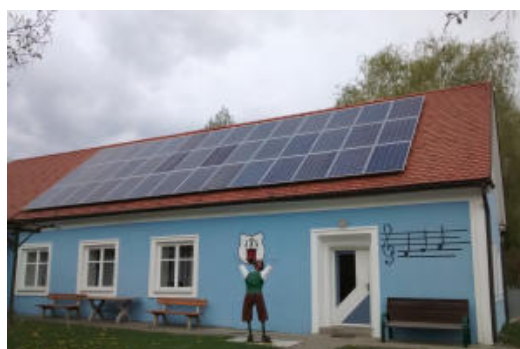
Abbildung 5: Vereinshaus mit PV-Anlage

Um einen möglichst durchgehenden Betrieb sicherstellen zu können, ist zudem eine Be-leuchtung erforderlich. Diese kann entweder über ein Notstromaggregat oder über eine inselbetriebsfähige/notversorgungsfähige Photovoltaikanlagen erfolgen. 11 Bei einer Notstromaggregatversorgung sind jedoch zahlreiche Aspekte zu berücksichtigen, 12 wie: