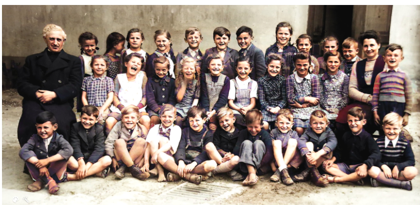
Volksschule 1941 und jünger