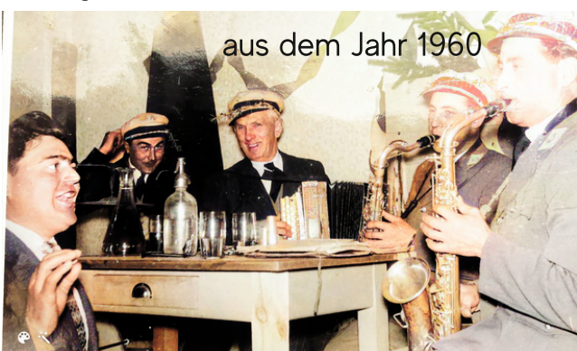
aus dem Jahr 1960