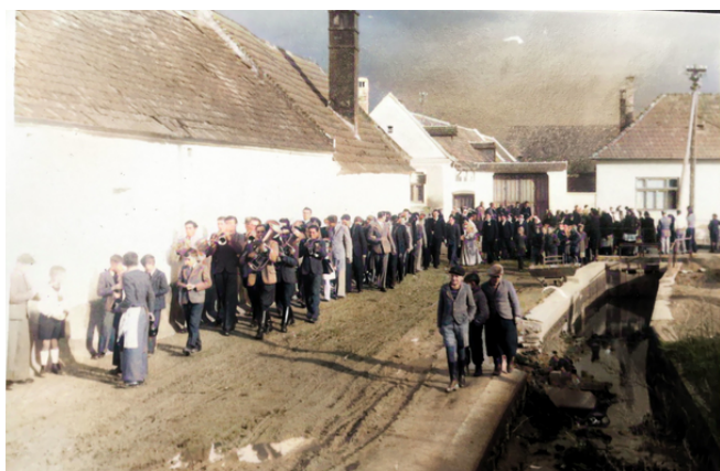
Pfarrgasse im Jahr 1950