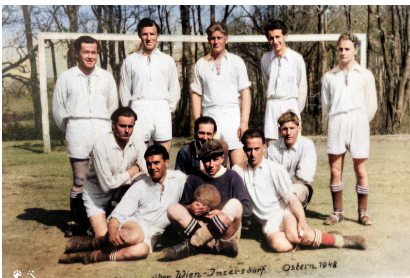
Sportverein Ostern 1948