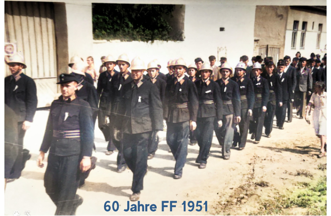
60 Jahre FF 1951