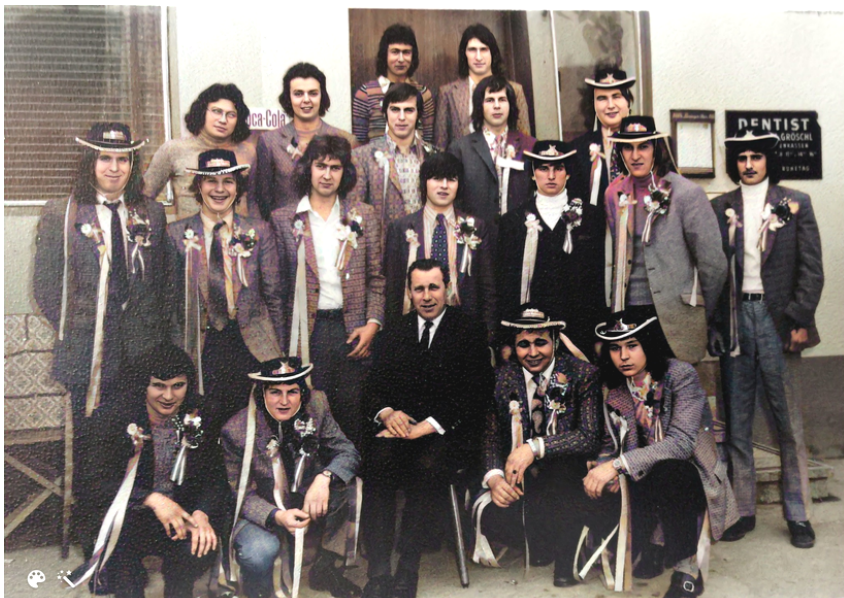
Stellung des Jahrganges 1953