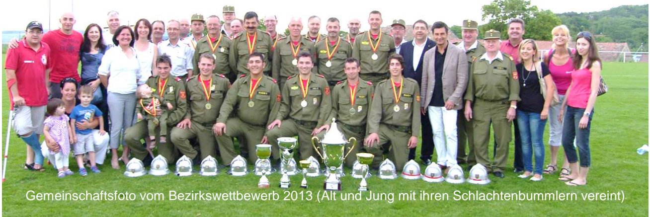
Gemeinschaftsfoto vom Bezirkswettbewerb 2013 (Alt und Jung mit ihren Schlachtenbummlern vereint)

Beim 58. Landesfeuerwehrleistungsbewerb 2013 in Oberwart setzten sich die Florianijünger aus Baumgarten wieder einmal verdient durch und holten den Landestitel nach Baumgarten. Wir gratulieren auf das Herzlichste und wünschen uns und den fleißigen Feuerwehrmännern, dass es auch in Zukunft so weiter gehen möge !!