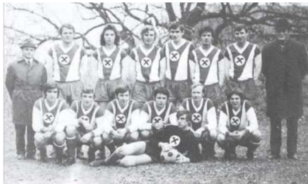
Mannschaft 1971 – 1972

Am Sonntag (5. Mai) wird unser zelebrieren.