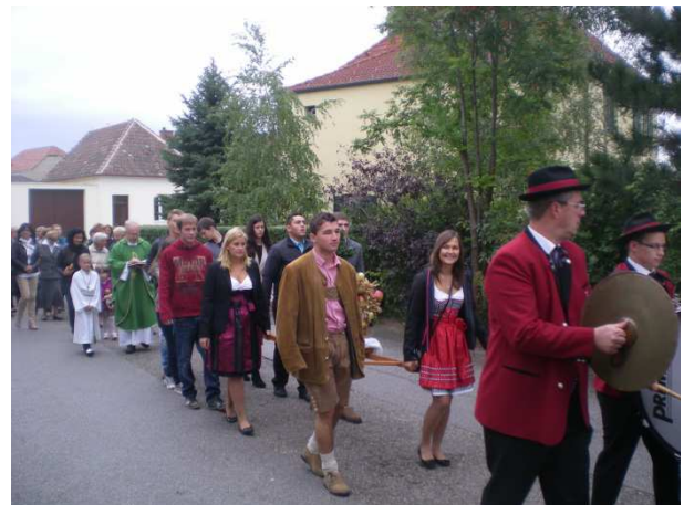
Die „Jungen“ mit der Krone