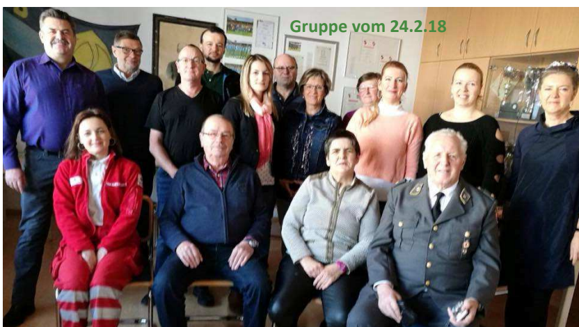
Gruppe vom 24.2.18