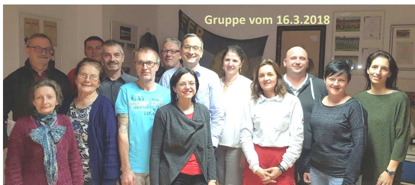
Gruppe vom 16.3.2018