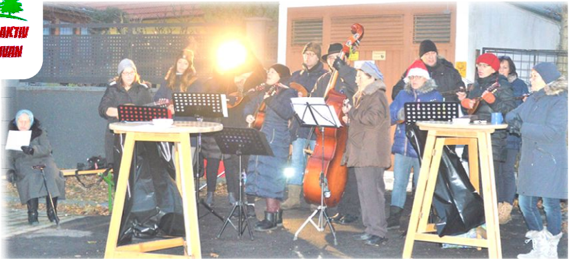
1. Adventfeier mit Tamburica Pajngrt