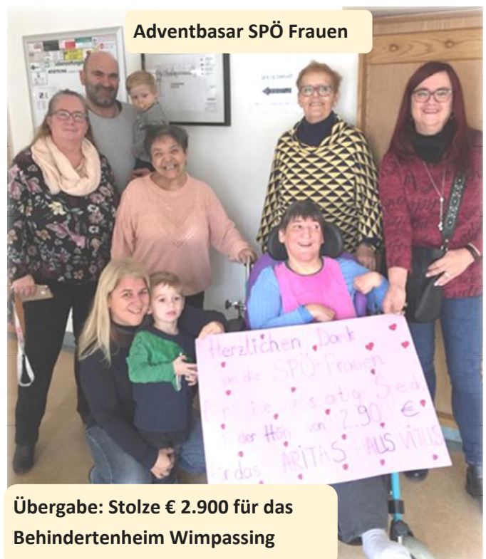
Übergabe: Stolze € 2.900 für das Behindertenheim Wimpassing